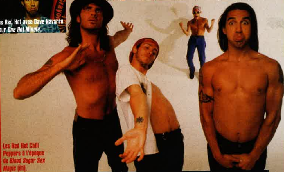
Les Red Hot Chili Peppers à l'époque de Blood Sugar Sex Magic (81).

IF YOU WANT ME TO STAY, I'LL BE AROUND TODAY... (If You want Me To Stay/Freaky Styley)