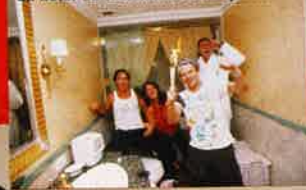
Un hôtel de tournée à rude épreuve...