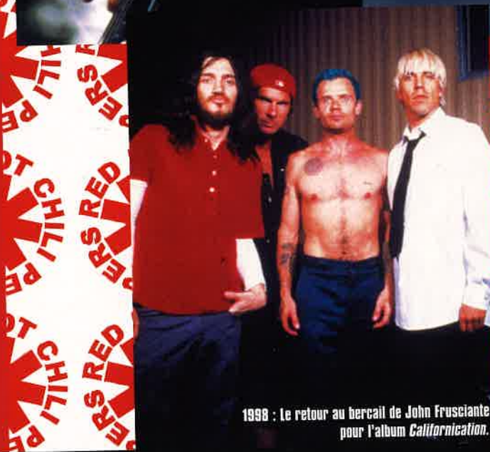
1998 : Le retour au bercail de John Frusciante pour l'album Californication .

THIS LIFE IS MORE SHINING IN THE SUN... (Road Trippin'/Californication)