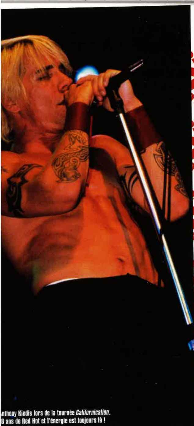
Anthony Kiedis lors de la tournée Californication. 8 ans de Red Hot et l'énergie est toujours là !